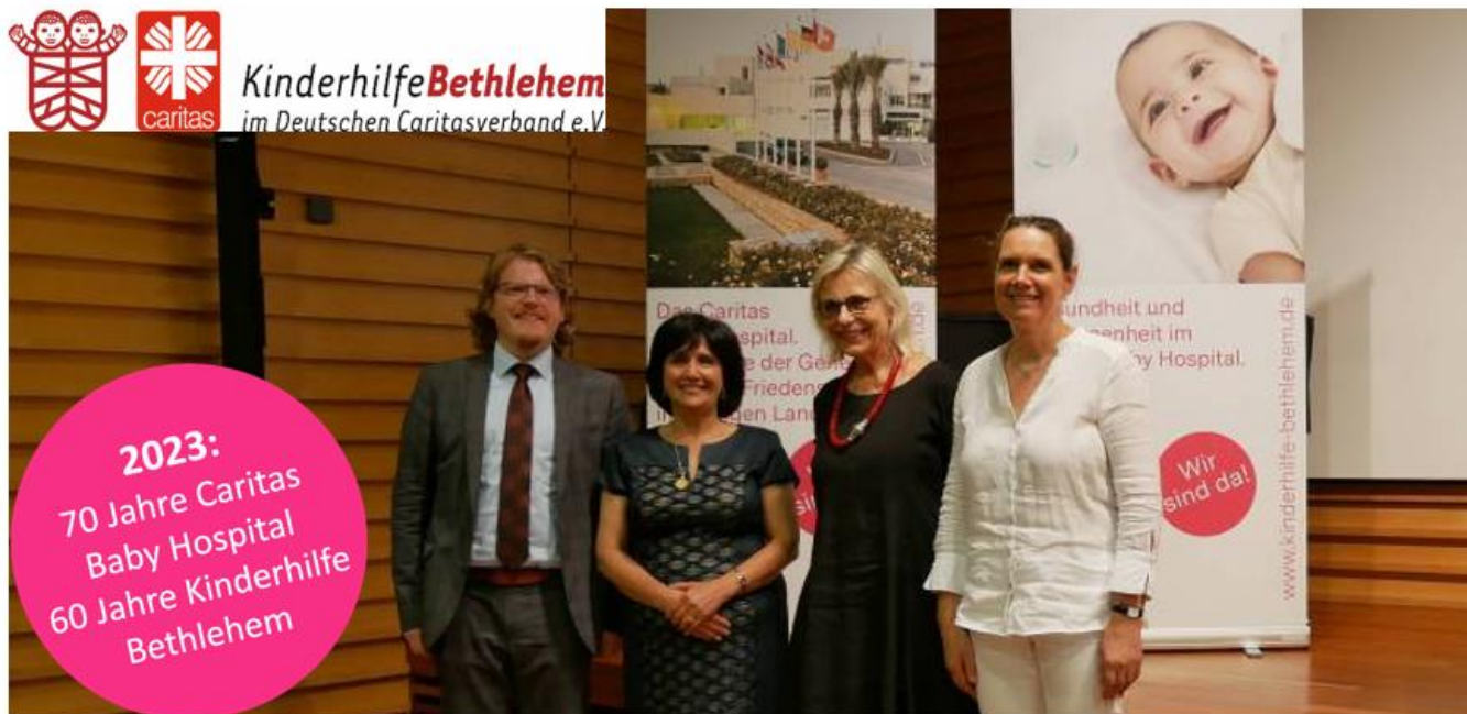
v.l.n.r. F.Freiseis, H.Marzouqa, S.Oetliker, C.Sibbing