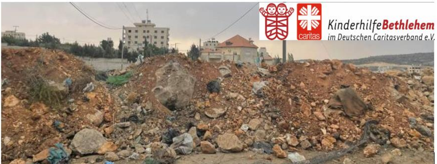
Blockierte Zufahrtsstraße nach Bethlehem