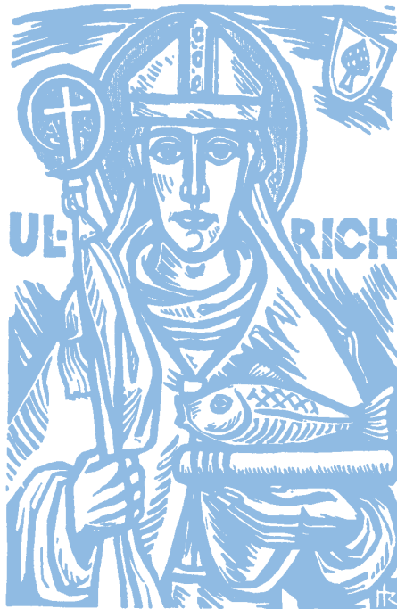
Bischof von Augsburg 890 – 973

9.00 Uhr in Schenkenzell: Festgottesdienst zum Patrozinium unter Mitwirkung des Kirchenchores mit Prozession unter Beteiligung der Musikkapelle anschließend „Ulrichs-Hock“ im Pfarrhof