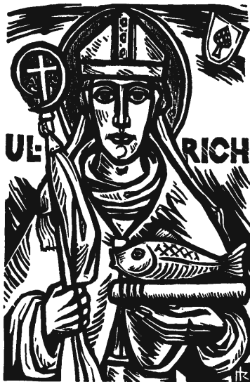
Bischof von Augsburg 890 – 973