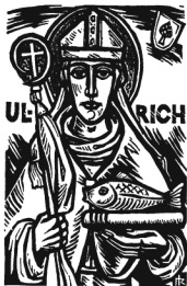
Bischof von Augsburg 890 – 973